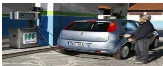
Fiat Punto motor 1.4 con gas natural

Tiene un origen similar al del petróleo y suele estar formando una capa o bolsa sobre los yacimientos de petróleo. Está compuesto, fundamentalmente, por metano ( \text{CH}_4 ). El gas natural es un buen sustituto del carbón como combustible, debido a su facilidad de transporte y elevado poder calorífico y a que es menos contaminante que los otros combustibles fósiles.