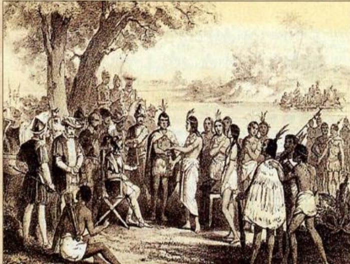
Imagen 1. grabado del siglo XVI de T. De Bry para la Historia de la destrucción de las Indias.