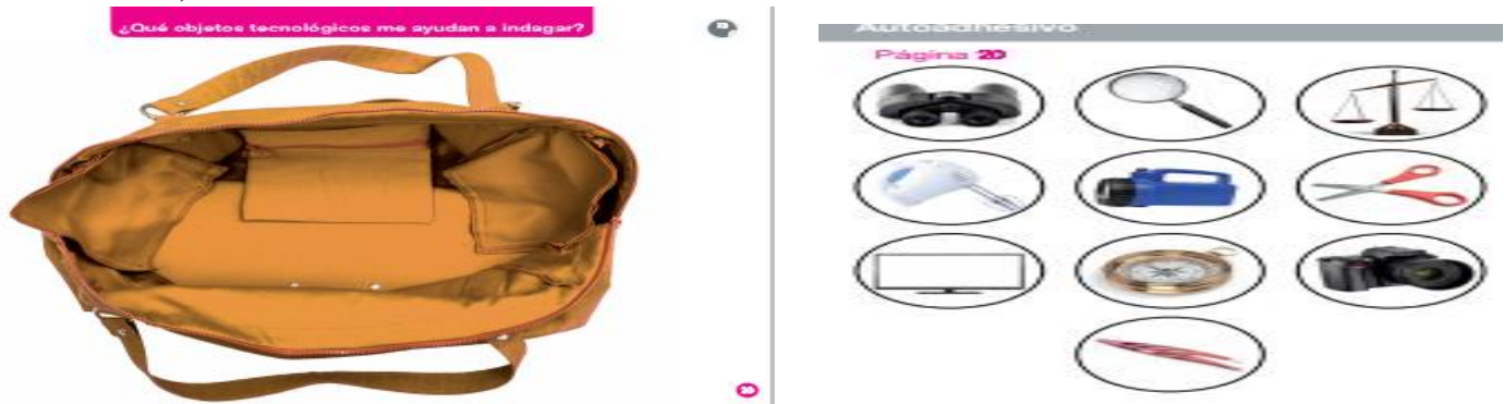
Autoadhesivo página 271..