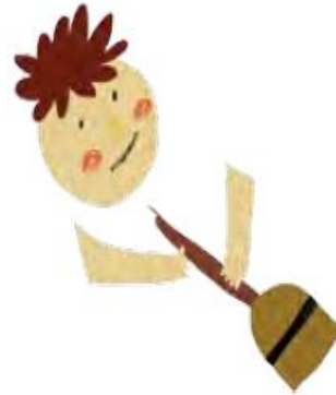
Limpiar la pieza