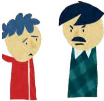
Obedecer a los padres

Actividad Nº 3 : Cuales de las siguientes acciones son las más de realizar en familia y luego completa el compromiso.