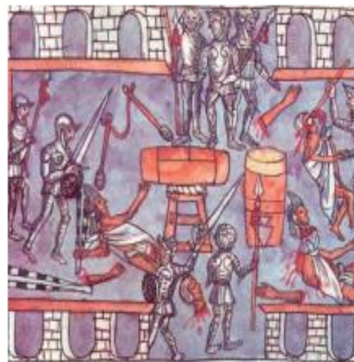
B Masanza del Templo Mayor. Pintura contenida en el Códice Durán.

Los tlaxcaltecas fueron los principales aliados de los españoles durante la conquista del México. Dicha alianza se frenó gracias a la rivalidad que existía entre Tlaxcala y los aztecas.