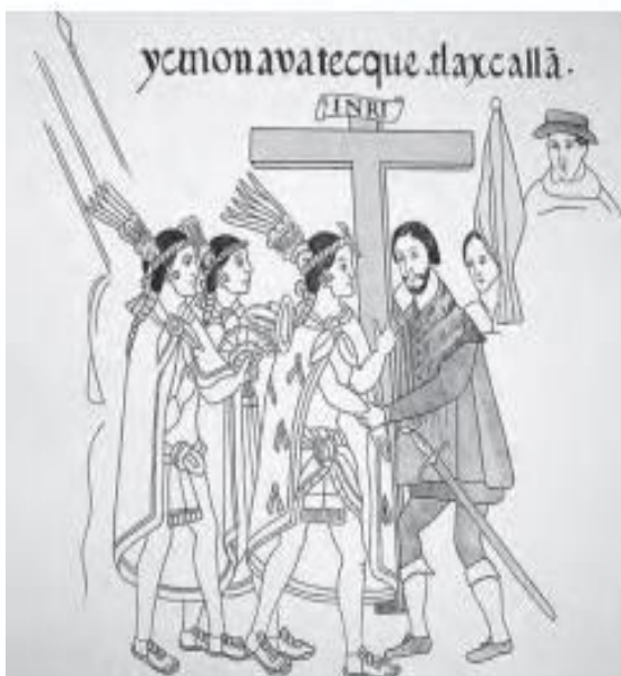
A Tlaxcaltecas en ceremonia católica. Lienzo de Tlaxcala.

Los tlaxcaltecas fueron los principales aliados de los españoles durante la conquista del México. Dicha alianza se frenó gracias a la rivalidad que existía entre Tlaxcala y los aztecas.