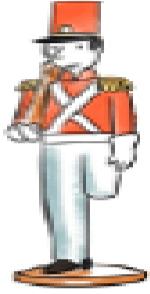
A. El soldadito.

1.- ¿Cuál era el juguete preferido de los niños? Marca.