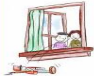
C. Los niños lo tiraron por la ventana.

3.- ¿Qué significa: “El soldadito de plomo estaba desesperado , pensando que no volvería a ver ni a la bailarina ni a los niños”? Marca