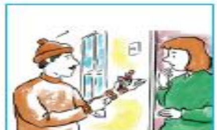
C. En las manos de un pescador.