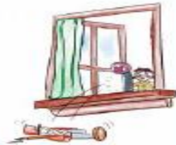
B. Otro juguete lo empujó.