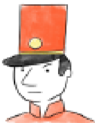
A. Estaba enojado.

3.- ¿Qué significa: “El soldadito de plomo estaba desesperado , pensando que no volvería a ver ni a la bailarina ni a los niños”? Marca