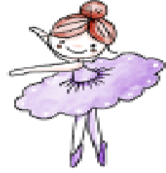
C. La bailarina.

2.- ¿Por qué el soldadito salió volando por la ventana? Marca