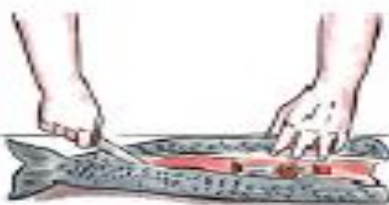
B. En el interior de un pez.