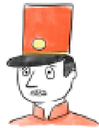
C. Estaba preocupado.

4.- ¿Cómo volvió el soldadito a la casa? Marca.