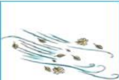
A. Había mucho viento.

2.- ¿Por qué el soldadito salió volando por la ventana? Marca