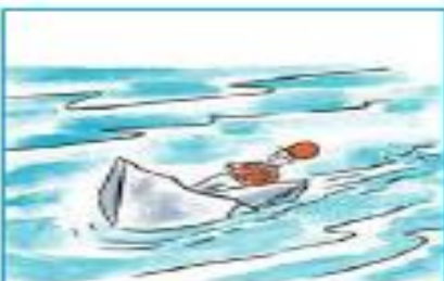
A. En un barco de papel.

4.- ¿Cómo volvió el soldadito a la casa? Marca.