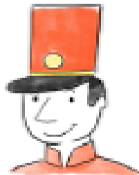
B. Estaba contento.