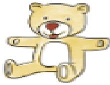
B. El oso.