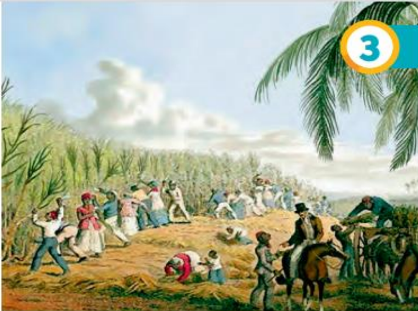
↑ Clark, William (1823). Recolección de caña de azúcar. [Grabado].