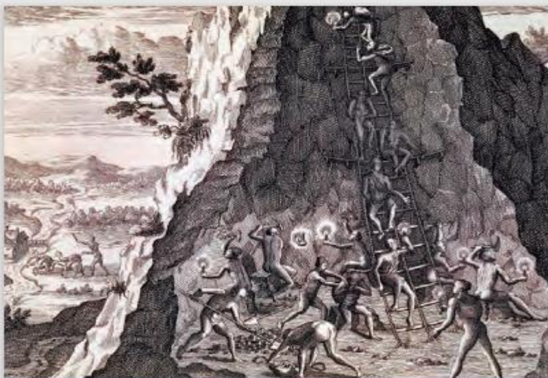
↑ De Bry, Theodor (siglo XVI). Mina de Potosí, Bolivia. [Grabado].