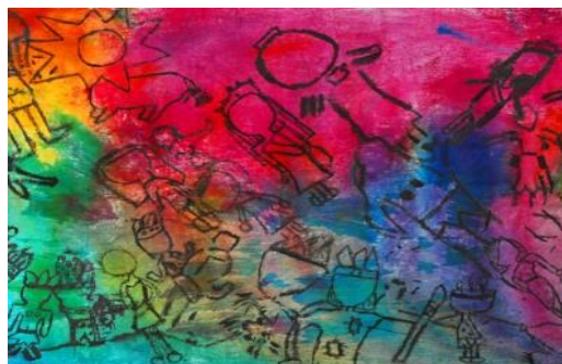
“Matta, teñido y color” Autor: Roberto Matta