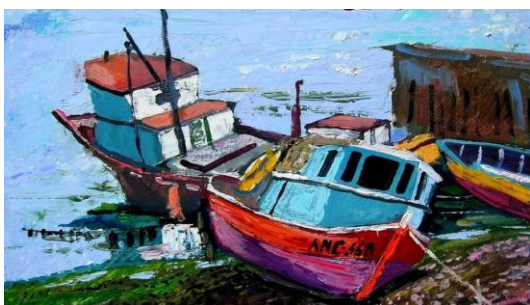
“Barcas Angelmo” Pintor: Juan Carlos Ruiz

E/A: Indica las producciones artísticas que son de tu agrado. Observa y encierra 2 de ellas por su contorno.