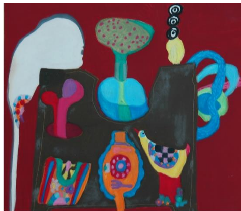
“La mesa del comedor”: Autora: Carmen Aldunate