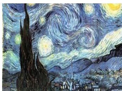
“La Noche Estrellada” Pintor: Vicent Van Gogh