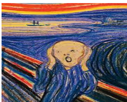
“El grito” Pintor: Edvard Munch