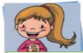
Catalina está animada