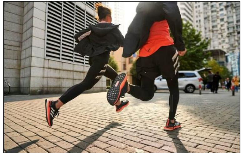
Run /ran/ “Correr”