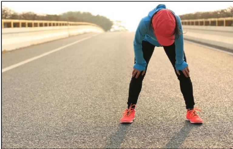
Rest /rest/ “Descansar”